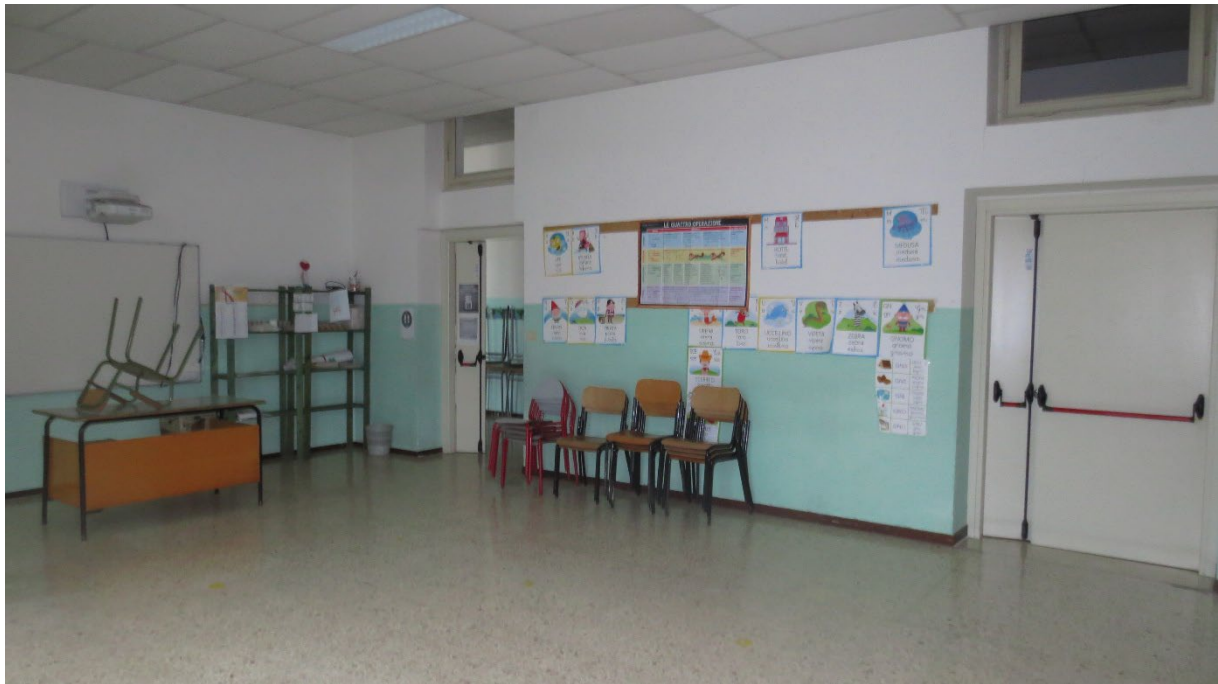
Figura 11: l'interno di un'aula