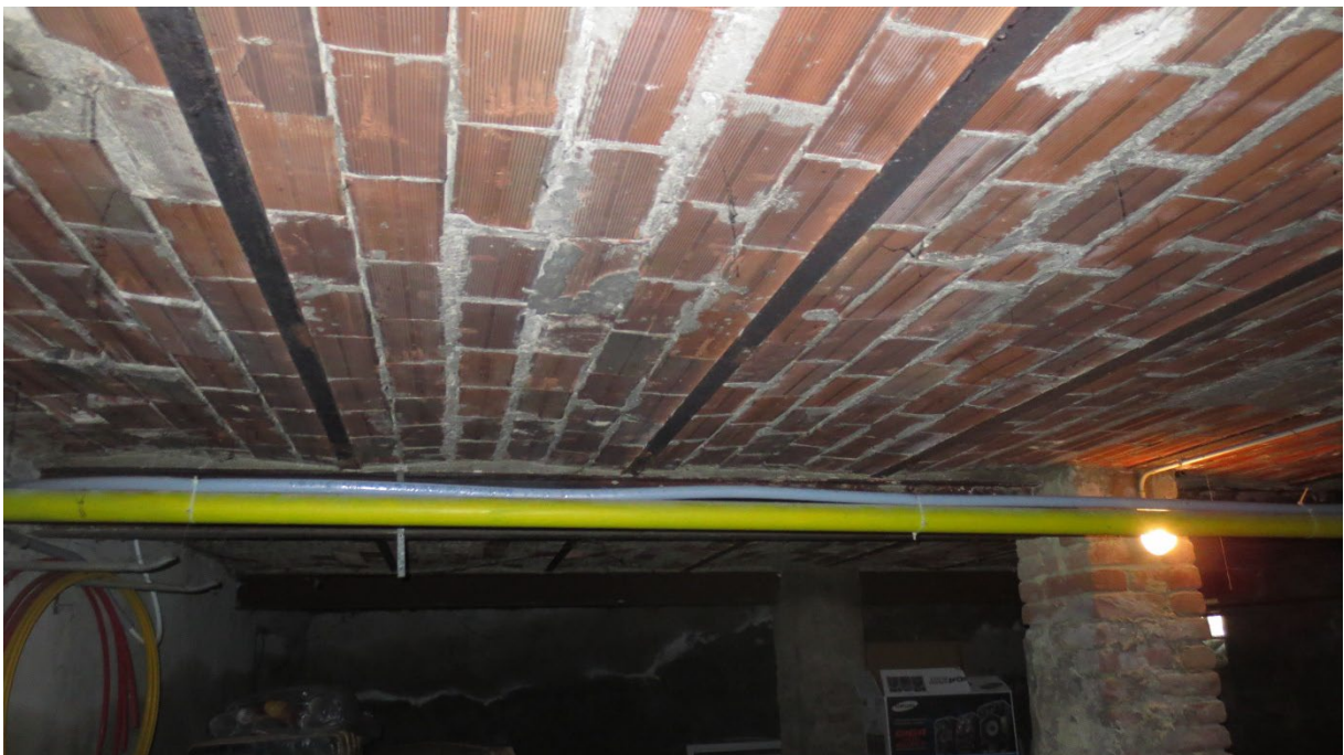
Figura 10: vista su un locale della cantina