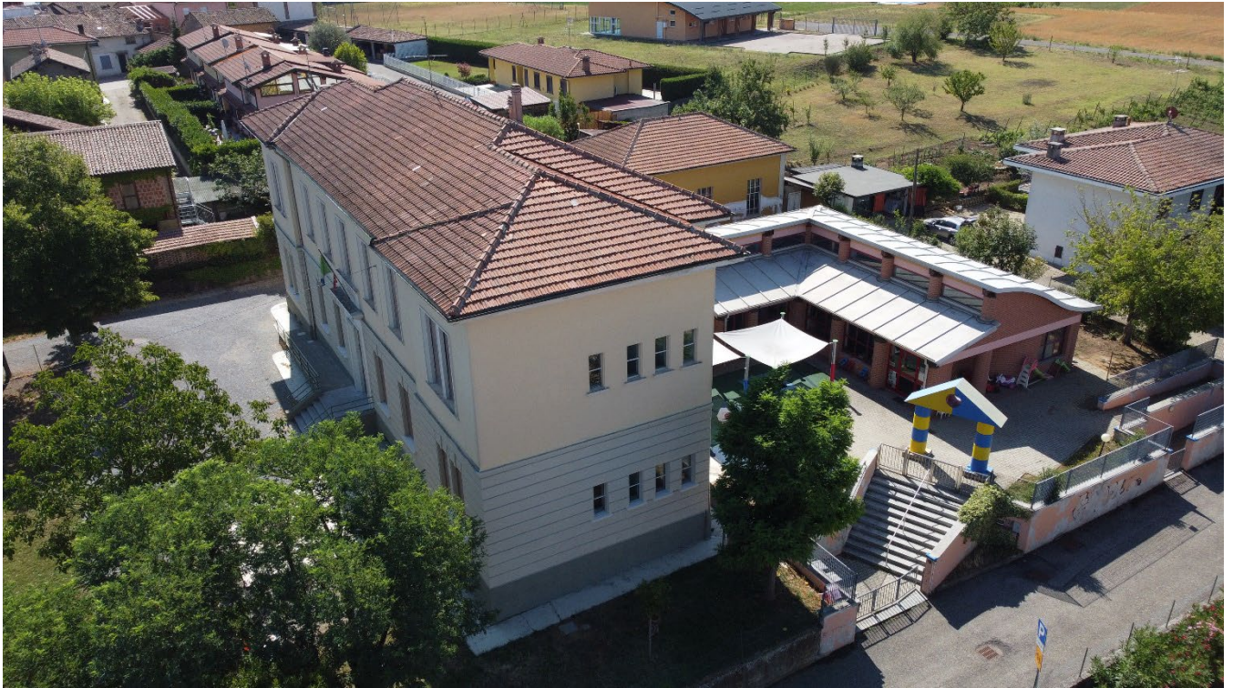
Figura 3: Facciata Ovest prima dell'intervento in facciata