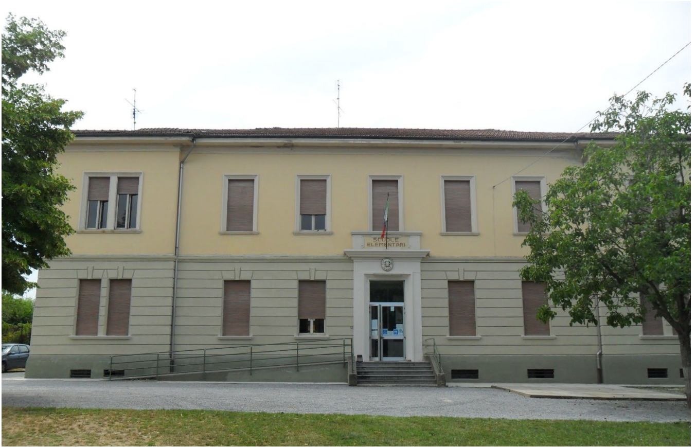
Figura 1: Facciata Nord a seguito della sistemazione del bugnato