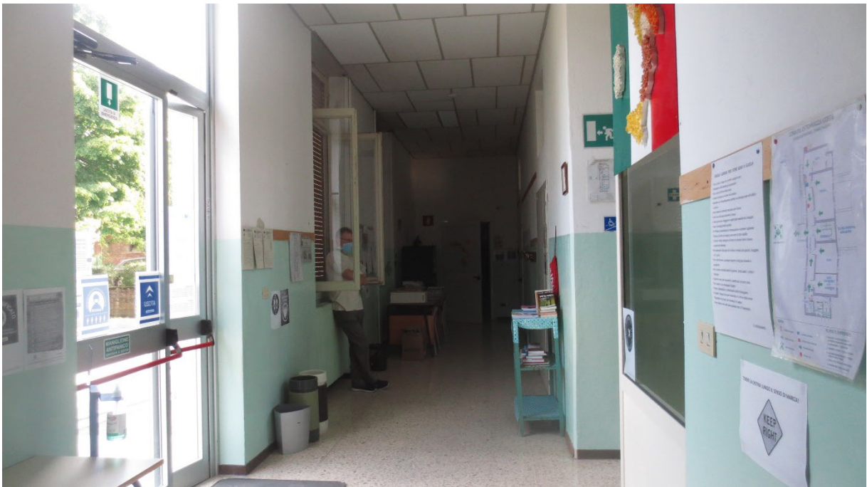
Figura 6: il corridoio distributivo al piano terra (piano rialzato rispetto al giardino esterno)