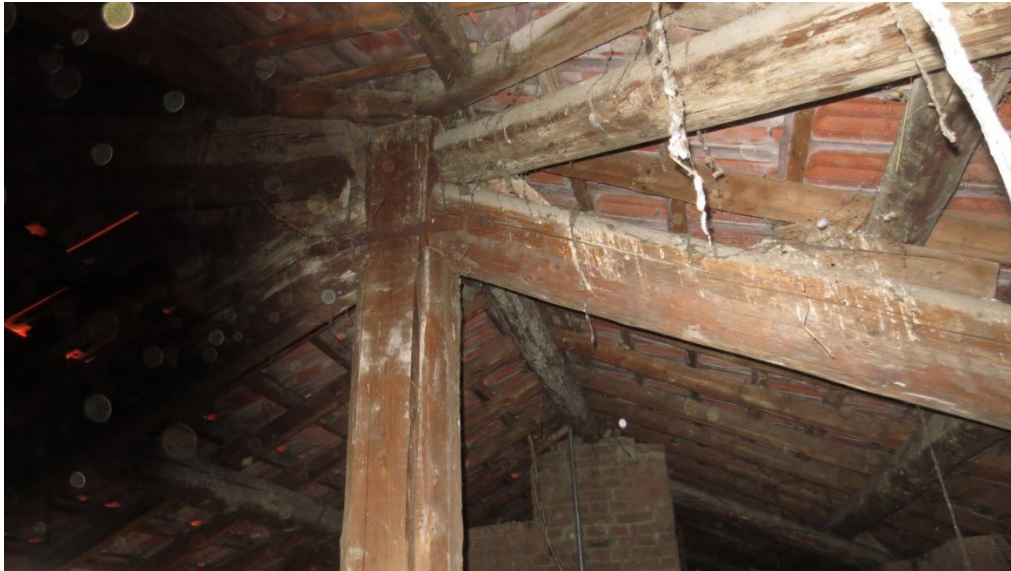
Figura 19: una delle capriate di copertura