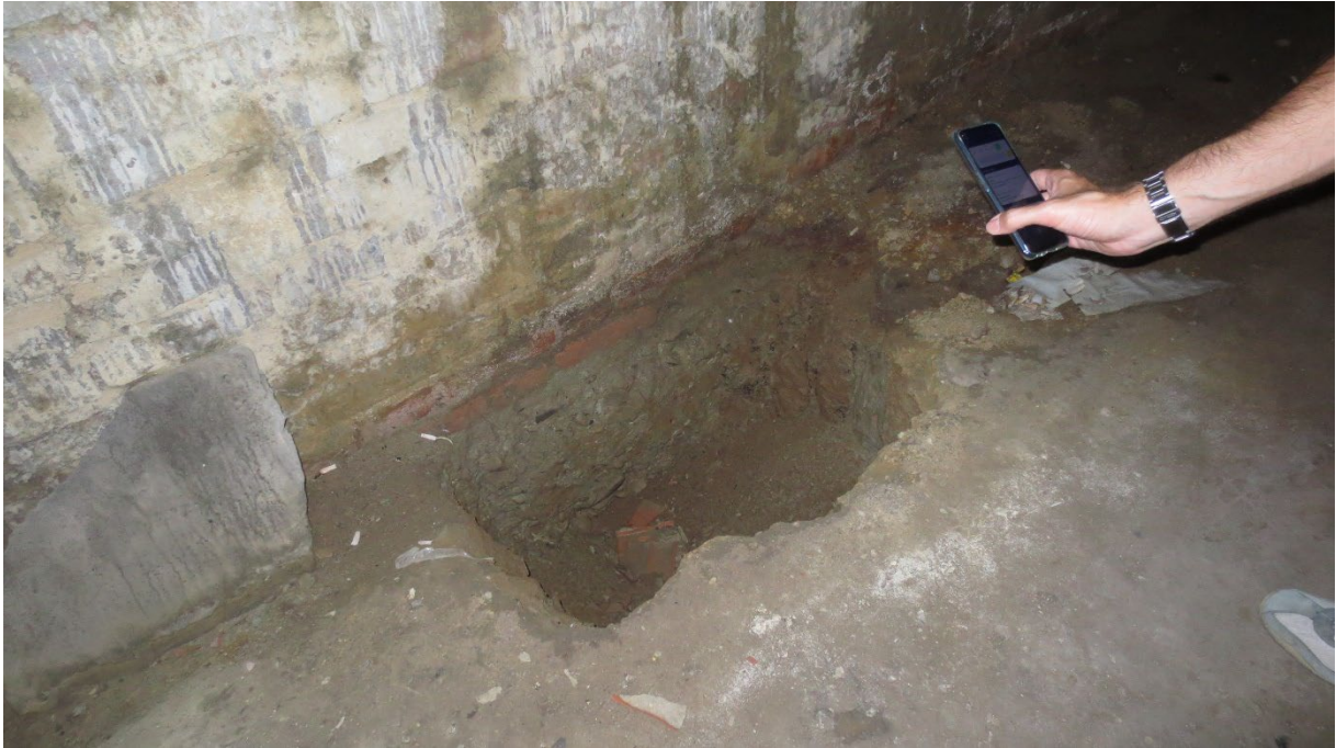
Figura 9: piccolo scavo per l'analisi della muratura sotterranea