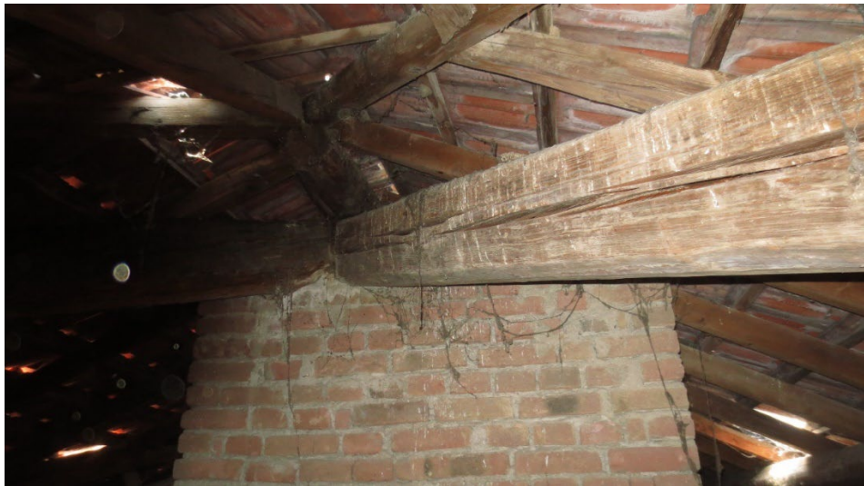
Figura 17: la struttura lignea della copertura e il sostegno delle murature verticali