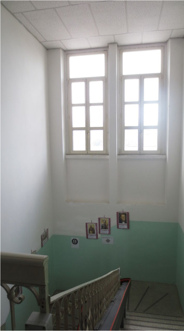
Figura 13: vano scale