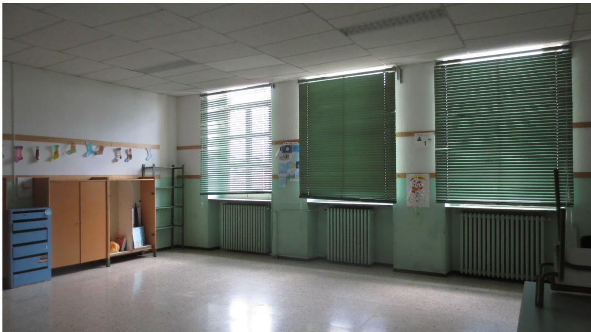
Figura 12: l'interno di un'aula