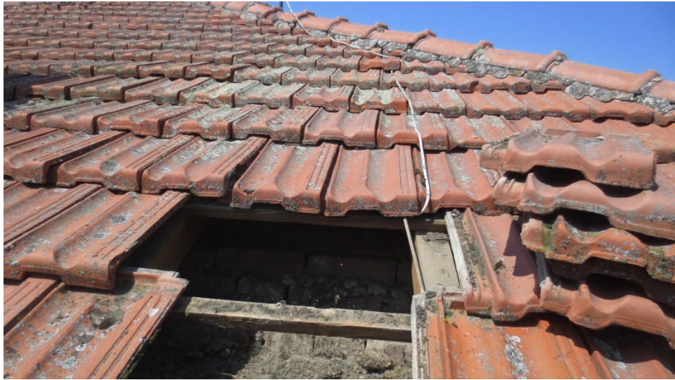
Figura 16: il rivestimento di copertura