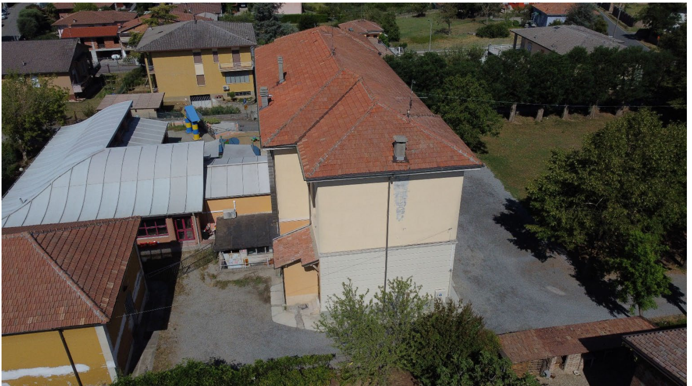
Figura 4: Facciata Est prima dell'intervento in facciata