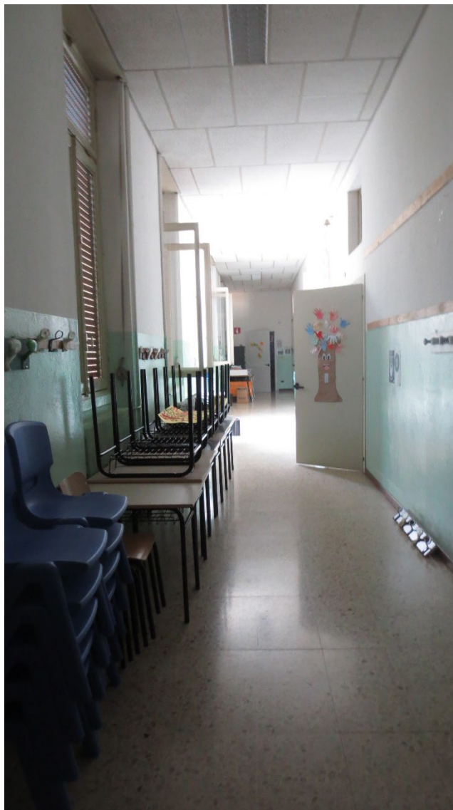
Figura 7: il corridoio al primo piano