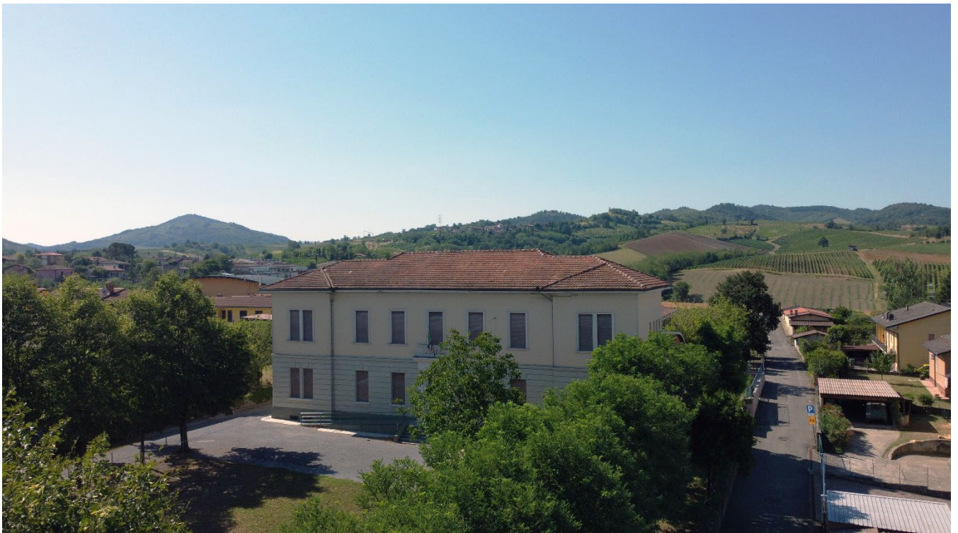
Figura 2: Facciata Nord prima della sistemazione della facciata