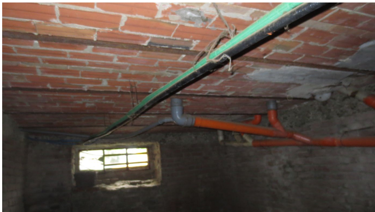
Figura 8: vista sul soffitto della cantina