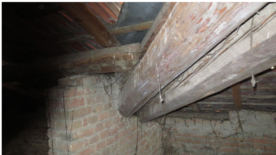
Figura 18: la struttura lignea della copertura e il sostegno delle murature verticali