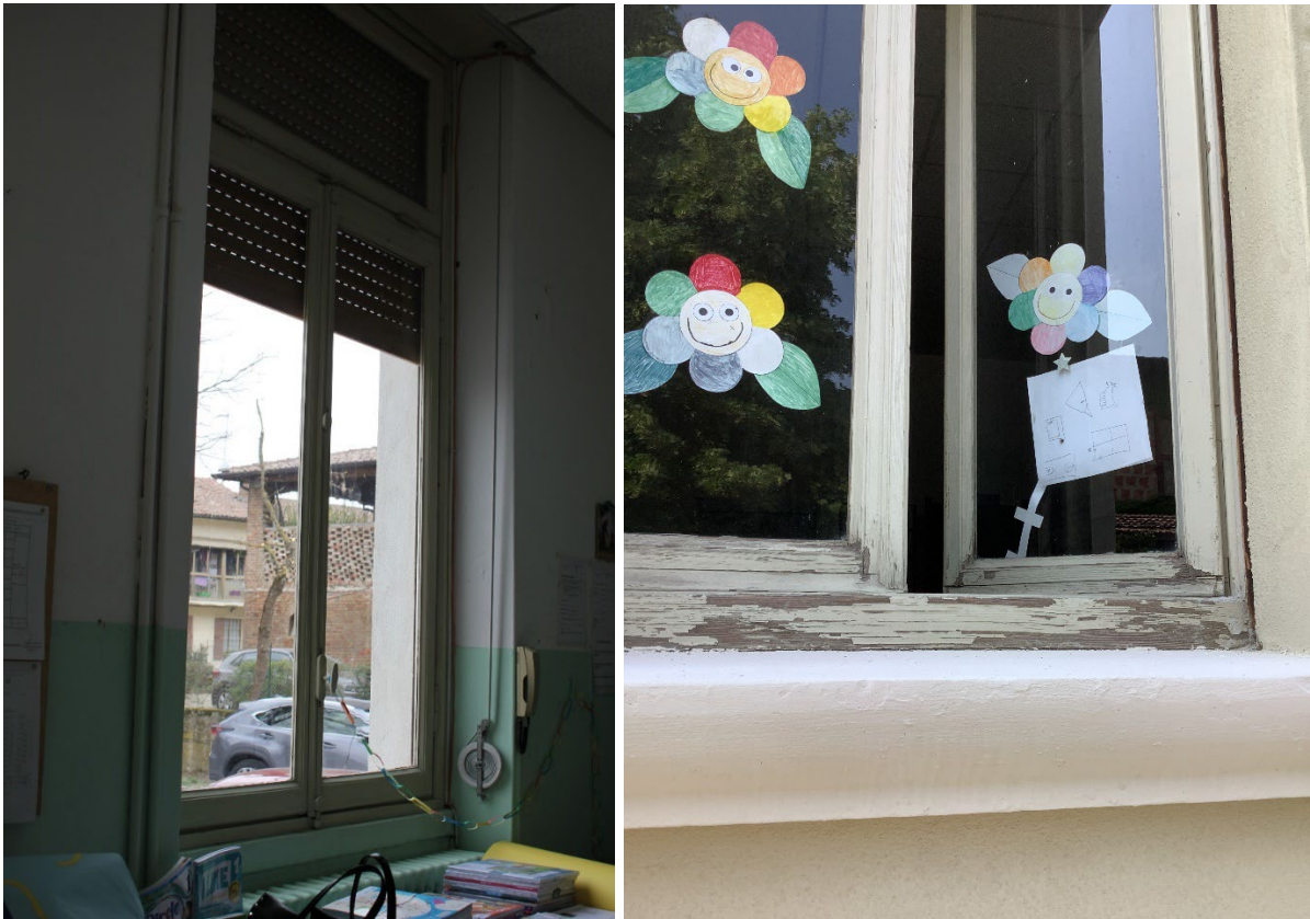
Figura 14: serramenti originali lignei dall'interno e dall'esterno