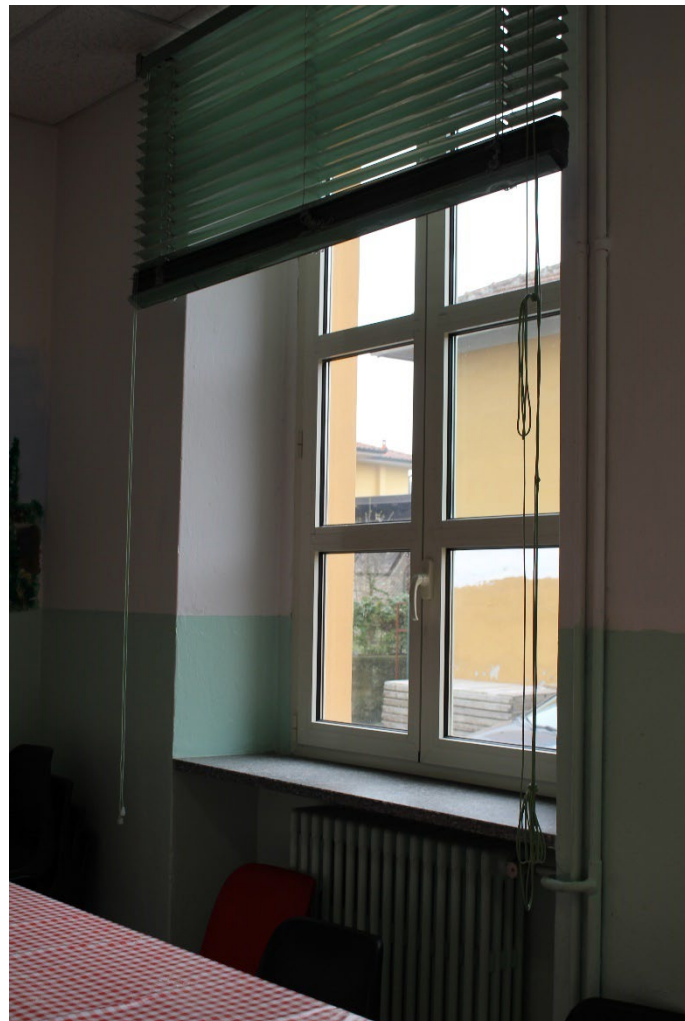
Figura 15: serramenti in PVC sostituiti con l'intervento del 2006 sulla facciata sud