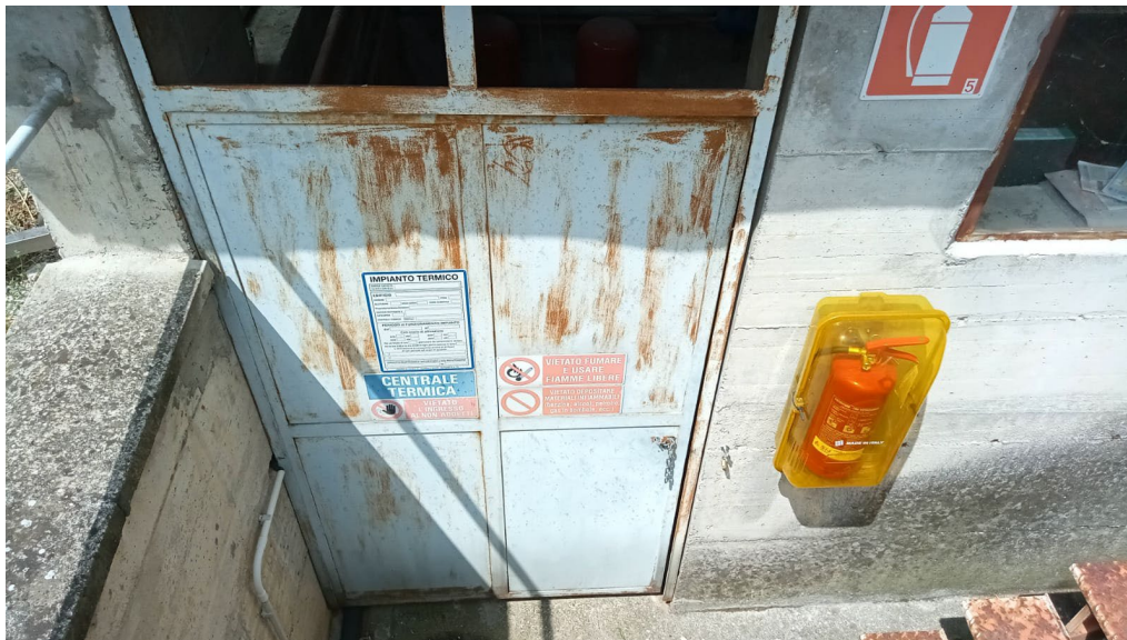
Figura 20: accesso al locale caldaia sul lato sud dell'edificio scolastico