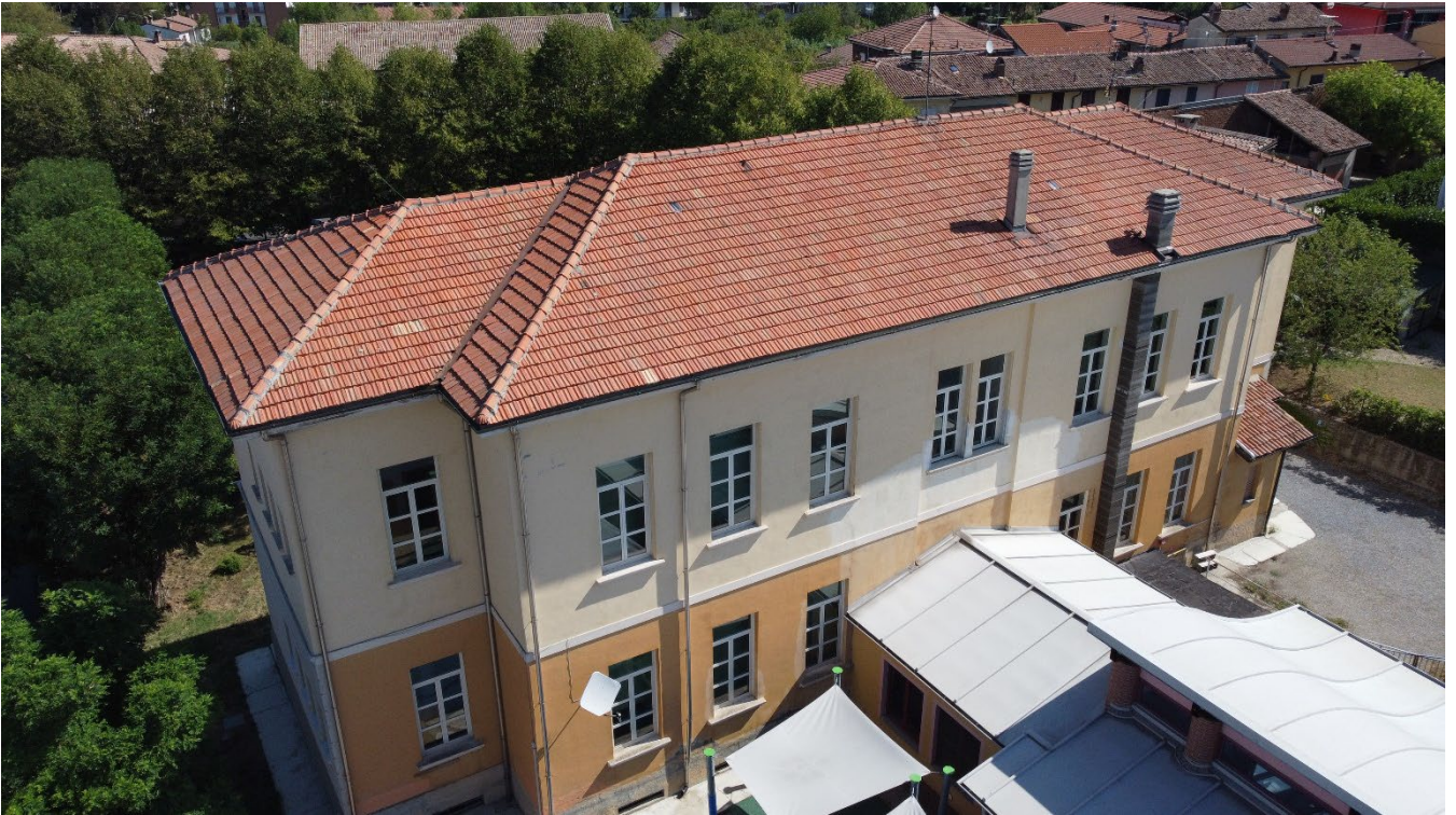
Figura 5: Facciata Sud allo stato attuale